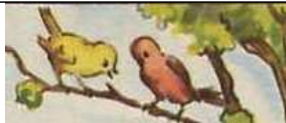
Les spectateurs (témoins directs qui peuvent en plus parler entre eux)