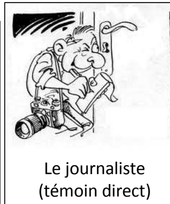
Le journaliste (témoin direct)